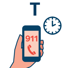
TIME TO CALL 911